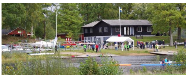
Runt 70 personer hade anmält sig till invigningen.

av banan för att för att invigningen, som startade klockan 11, skulle kunna ske med gott samvete.