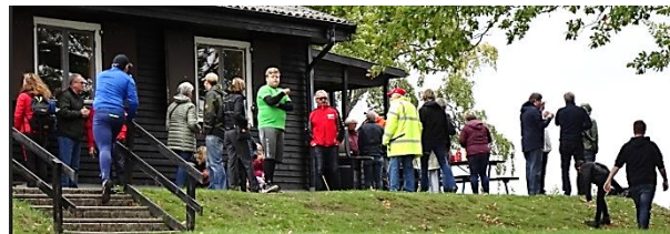
Efter invigningen serverades grillat och kaffe med kaka

Om de nya banornas. Vid invigningen var de sex 2000 m roddbanorna i sjön även om det bara var de sista 500 metrarna som var fullt bojade. Banan håller internationell standard med boj på var tionde meter och på var femte under de första 100 metrarna. Montering av de extra tre vajrar som möjliggör omställning till 9 st 1000 m kanotbanor sker först inför nästa säsong.